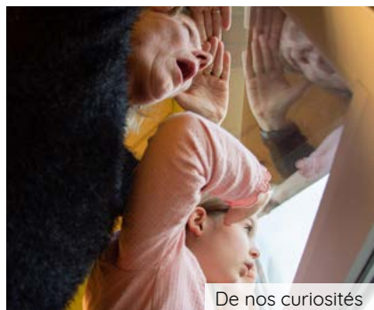
De nos curiosités