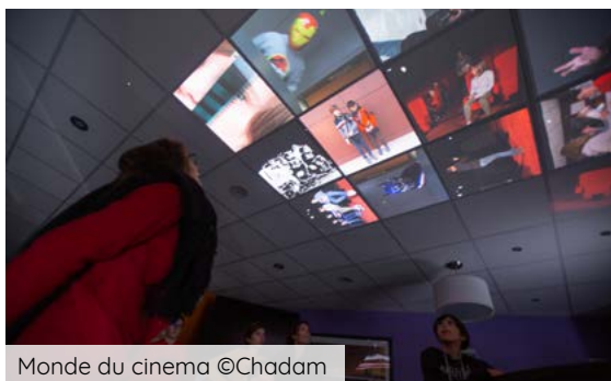
Monde du cinema