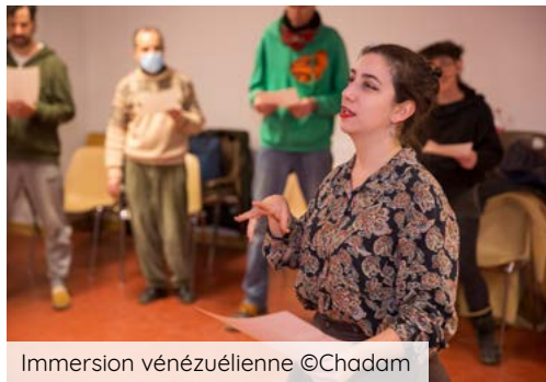
Immersion vénézuélienne