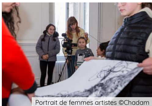
Portrait de femmes artistes ©Chadam