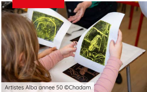
Artistes Alba annee 50 ©Chadam

Les actions illustrées ici se sont déroulées dans et pour des équipements, structures et villages d'Alba-la-Romaine, Aubignas, Cruas, Le Teil, St-Lager-Bressac, St-Bauzile, St-Vincent-de-Barres.