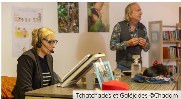
Tchatchades et Galéjades ©Chadam